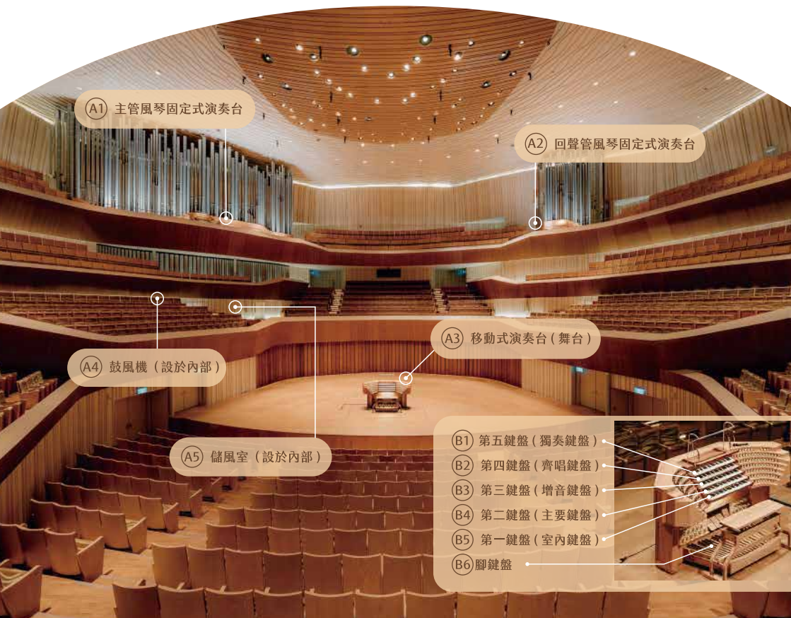
(A1) 主管風琴固定式演奏台

因此，衛武營國家藝術文化中心在規劃時，就決定要在音樂廳內建置管風琴，委託德國波昂百年管風琴製造商克萊斯(Johannes Klais Orgelbau)量身打造，歷經三年多時間完成，共有9085支音管與127支音栓，為目前亞洲最大的音樂廳演奏用管風琴。與葡萄園式觀眾席融為一體的外觀設計，更是讓來訪的世界級管風琴家們驚艷不已！