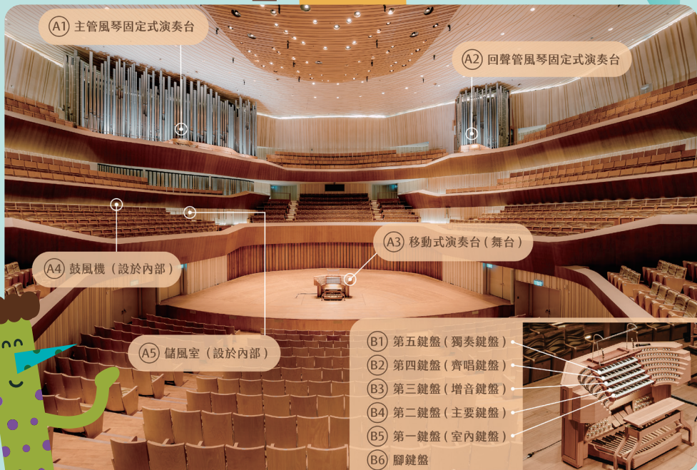
(A1) 主管風琴固定式演奏台