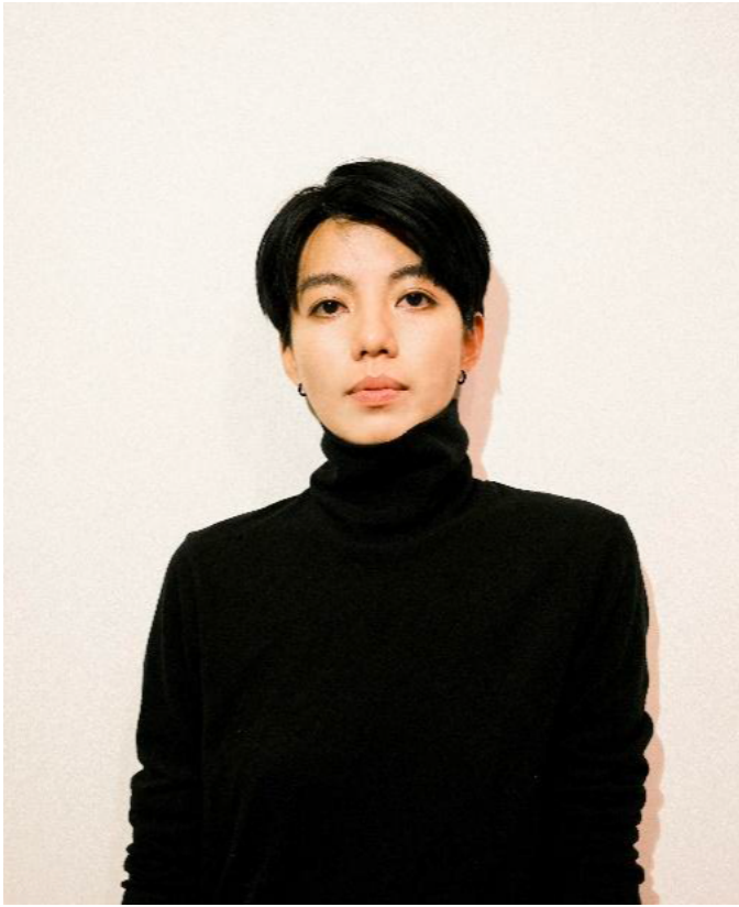
燈光設計 | 曾睿璇

經常擔任燈光設計及國際巡演技術統籌。作品著重由概念性探討出發，將光與材質之觀察、時間之相對性，予以拼貼、再現。2025 年與洪千涵、洪唯堯，共同創作、表演作品《FAMILY TRIANGLE：二三生，三生萬物》於臺北藝術節首演。近年多與音樂劇場合作，使用光創造視覺與感官上之空間，作品有 2024 臺灣劇場藝術節公聲藝術《共振計畫：拍頻》。